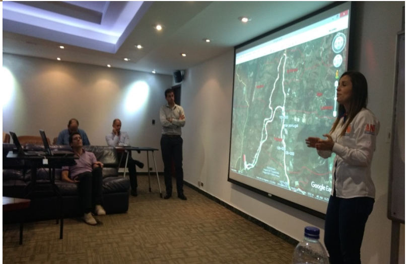
REUNION ORGANIZADA CAMARA DE COMERCIO – 25 DE MAYO DE 2017