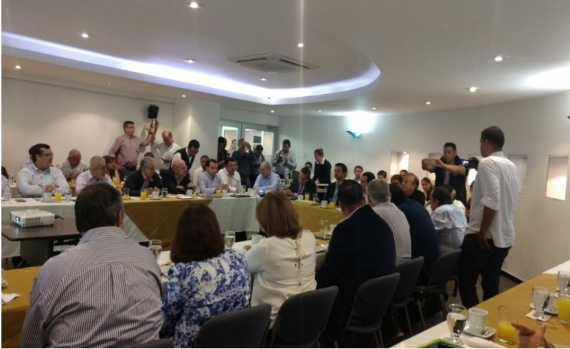
REUNION ORGANIZADA POR LA CAMARA DE COMERCIO Y GOBERNACION DE SANTANDER – 24 DE ABRIL DE 2017