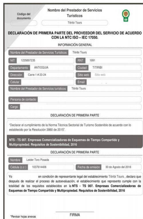
Figura1. Formato de Declaración De Primera parte. El documento será cargado al momento de realizar la inscripción o renovación del RNT.